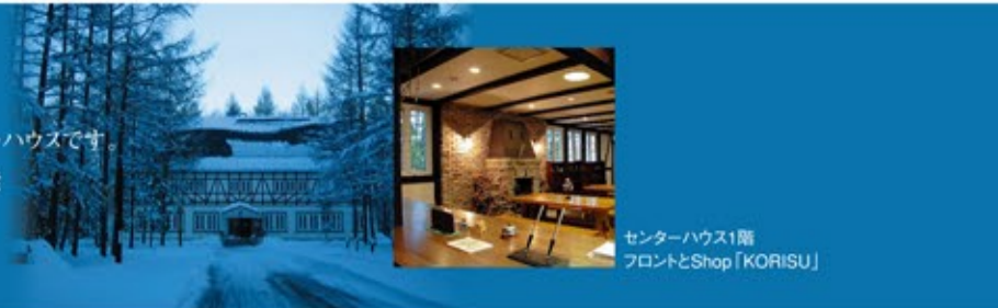
センターハウス1階 フロントとShop「KORISU」

針葉樹に囲まれた新雪の直線道路を左折、さらにその先に見えるのが、ドイツ風木組みづくりのセンターハウスです。まずはフロントでチェックインを済ませてから、ほっといとき暖炉の炎と目に優しい照明が旅の疲れを癒します。